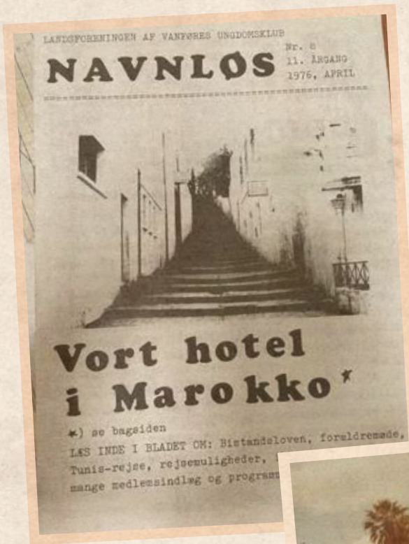
Billeder og udklip fra kolonier