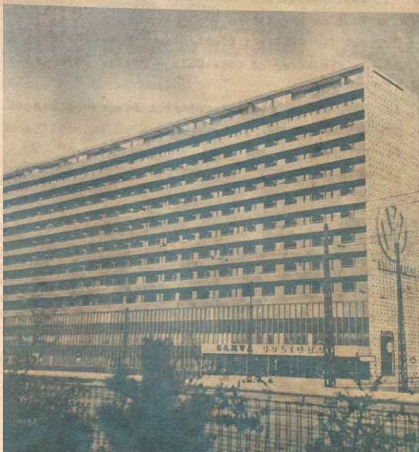
Gammelt billede af Kollektivhuset