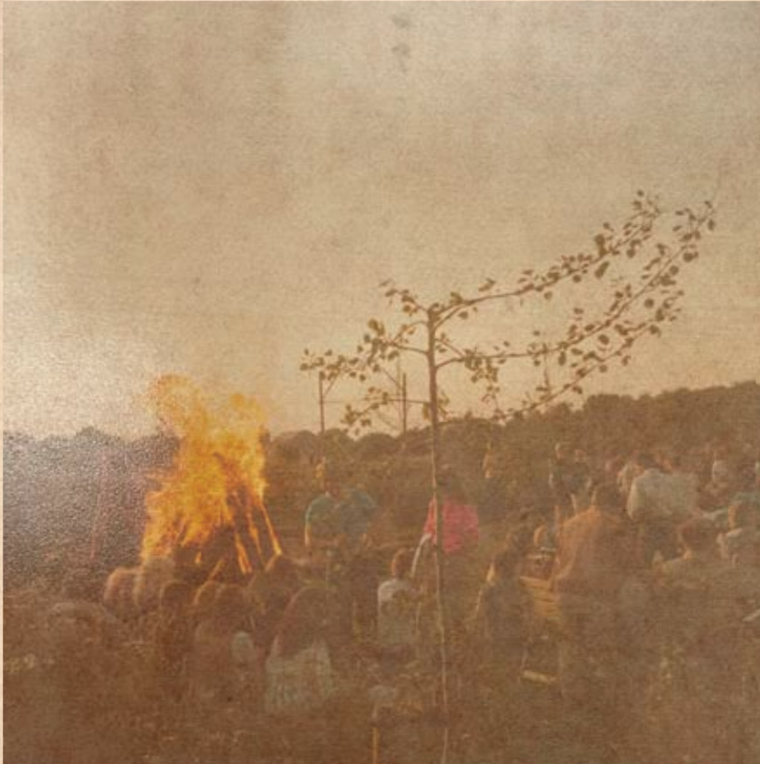
Gammelt billede af Sankt Hans fest på Borgervænget